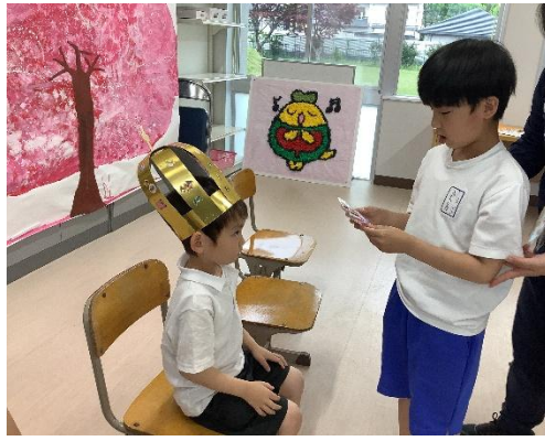
王冠とストラップのプレゼント