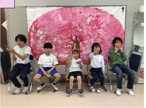
☆これからよろしくね☆