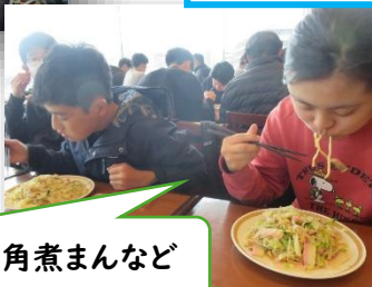
長崎名物の皿うどんや角煮まんなど