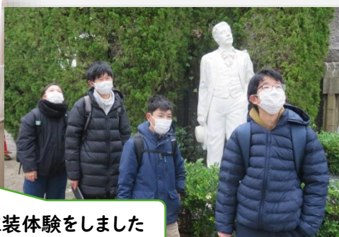
衣装体験をしました