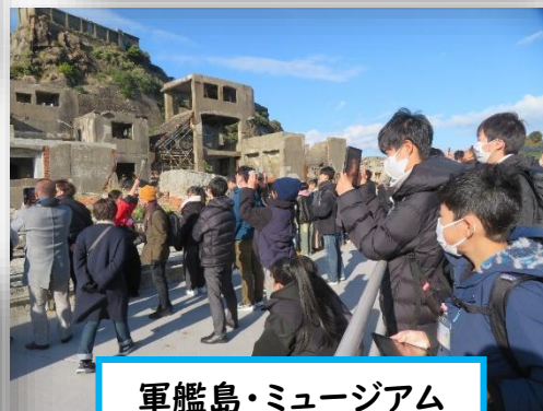
軍艦島・ミュージアム