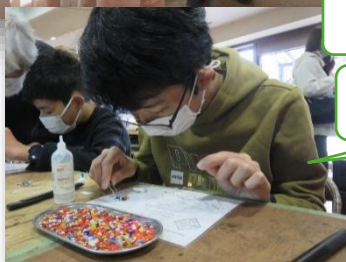
ガラス細工を作りました