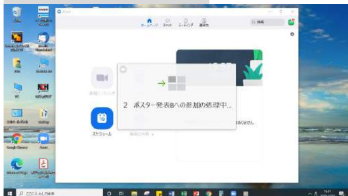
③移動が完了するまで、待機。