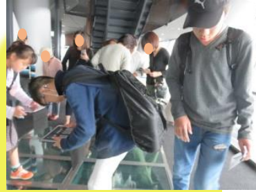
東京スカイツリー