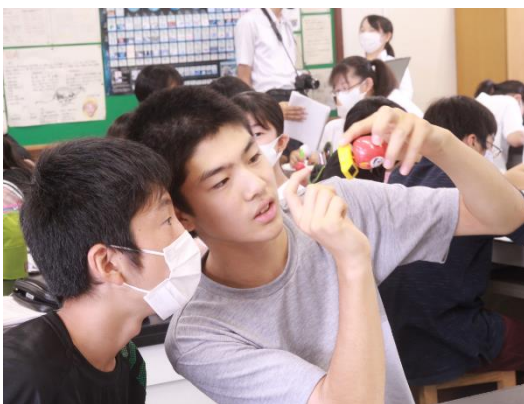
図2 ゆらゆら人形の構造を考えるようす