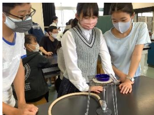
図4 未知の物質を取り出そうと実験するようす

生徒たちの対話からは、何らかの気体が発生したという客観性を手がかりに、探究心を高めているようすが見られた。また温度と状態の関係に気づき、状態変化があり得るのか、別の物質に変化した可能性があるのかという2つの点に疑問をもち始めた。