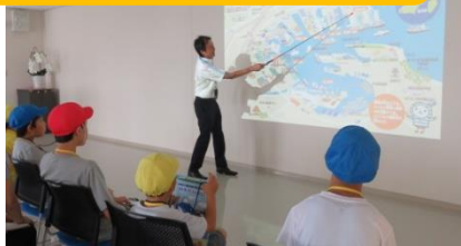
コンテナターミナルの見学